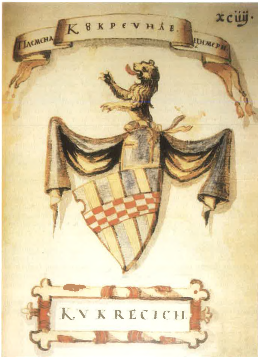
Sl. 2. Grb Kvkrecich u Korjenić-Neorićevu grbovniku iz 1595.