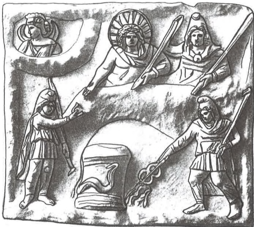
Sl. 1. Mitreo di Felicissimo: simboli inicijacijskog stupnja (CIMRM 299).

Fig. 1. Ostia, Mitreo di Felicissimo: Symbols for the fifth grade of initiation (CIMRM 299).