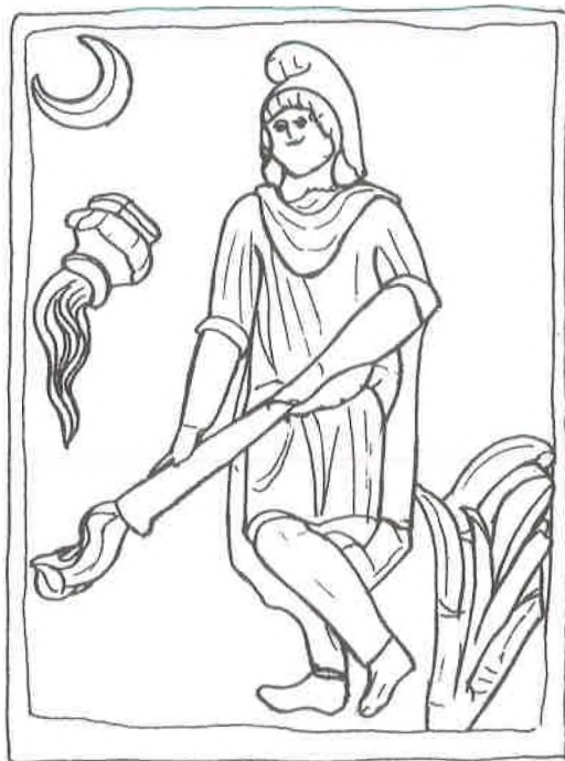
Sl. 2. Bononia: reljef CIRM 694 s Cautopatom s mjesečevim srpom.