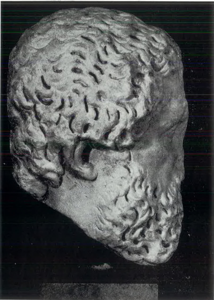
Glava Eshila u Arheološkom muzeju u Splitu