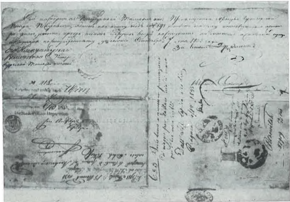
Njegošev pasoš (vize i druge potvrde)