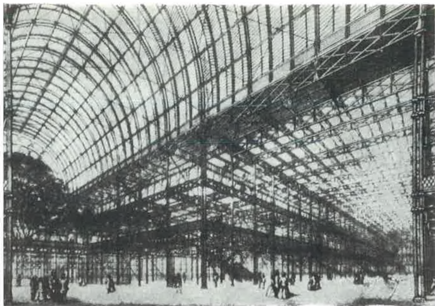
Zgrada Svjetske izložbe u Londonu 1851. god. (unutrašnjost)