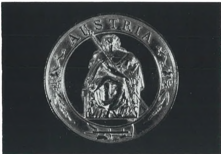
Mala srebrna medalja Bečke izložbe 1857. (avers)