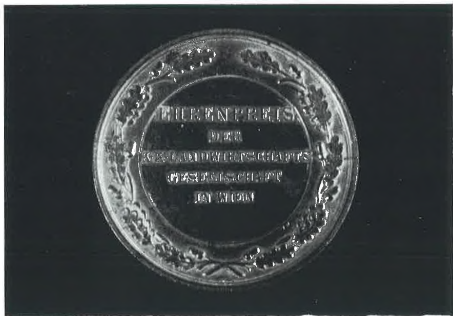
Mala srebrna medalja Bečke izložbe 1857. (revers)