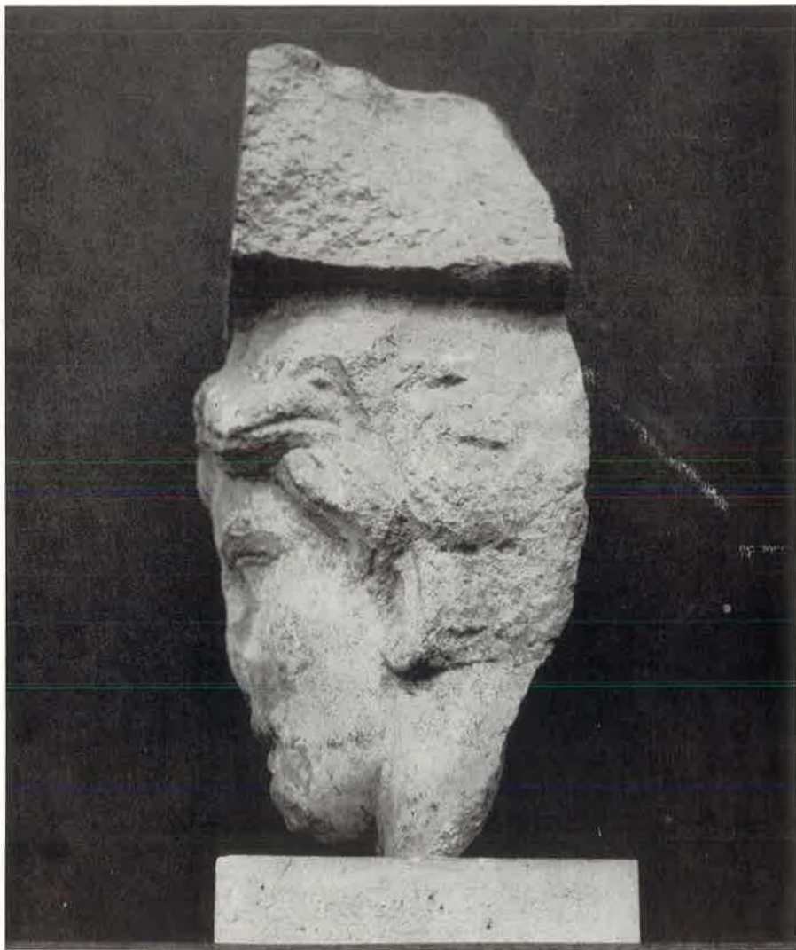
Glava jednog Ptolomejevića. (Arheološki muzej u Splitu).