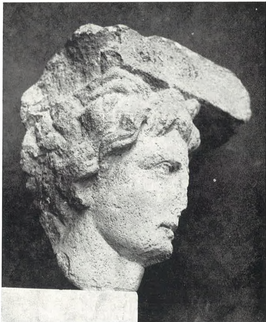
Glava Aleksandra Velikoga (Arheološki muzej u Splitu).