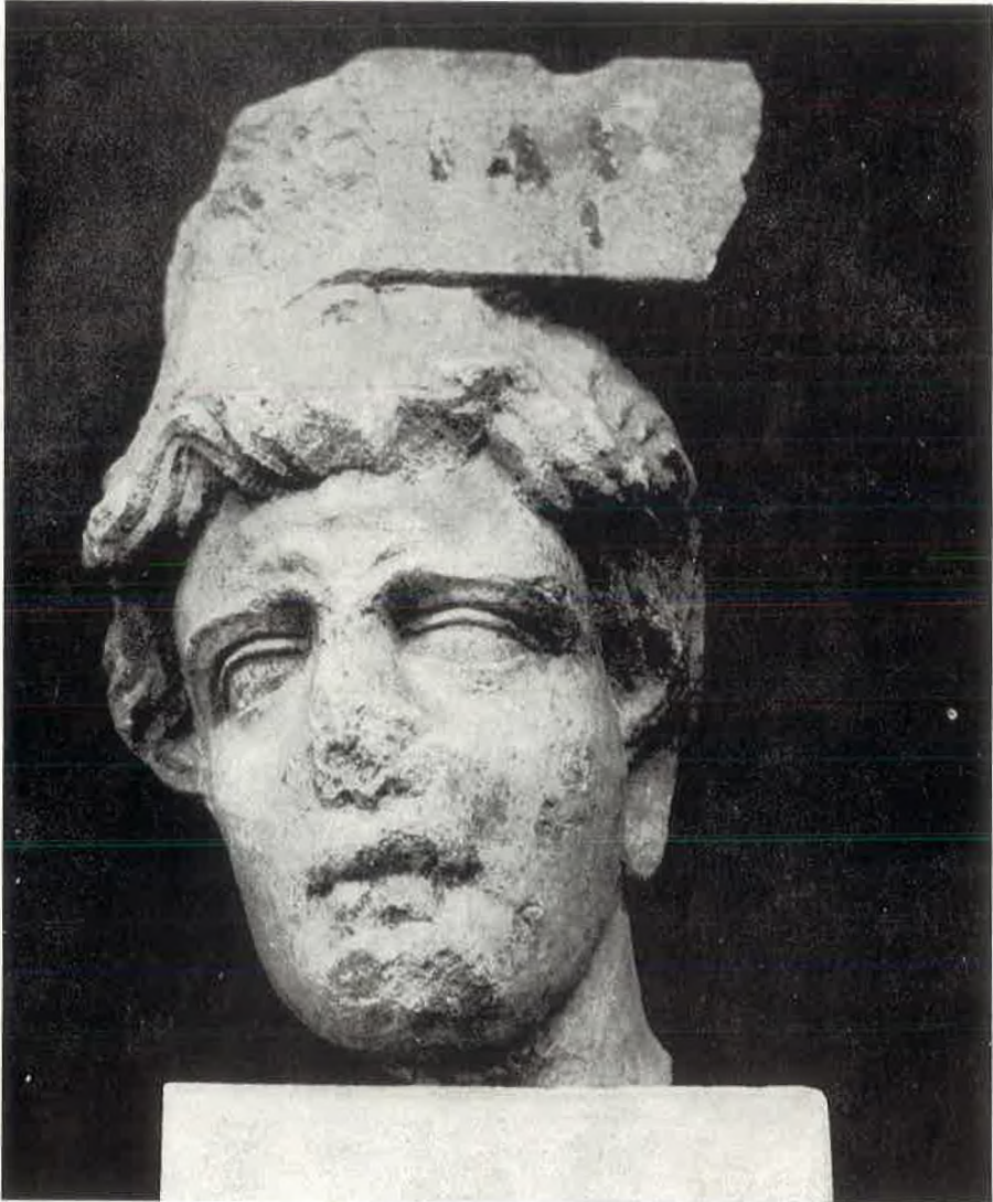
Glava jednog Ptolomejevića. (Arheološki muzej u Splitu).