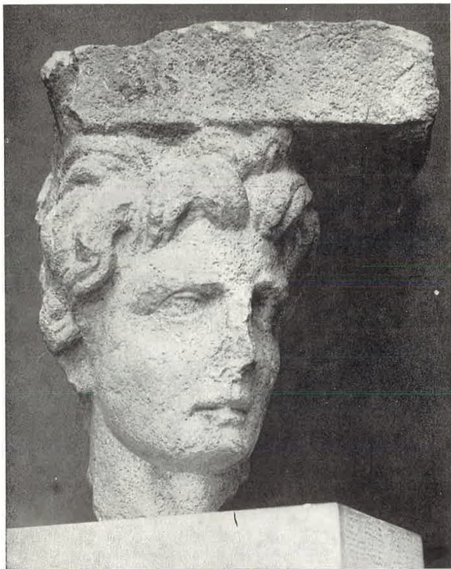
Glava Aleksandra Velikoga (Arheološki muzej u Splitu).