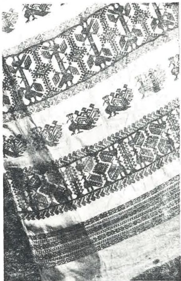
Sl. 3. Jedan kraj platnene pokrivače u raki sv. Šimuna u Zadru s polihromnim ukrasom u prijeboru i pretkivanju.