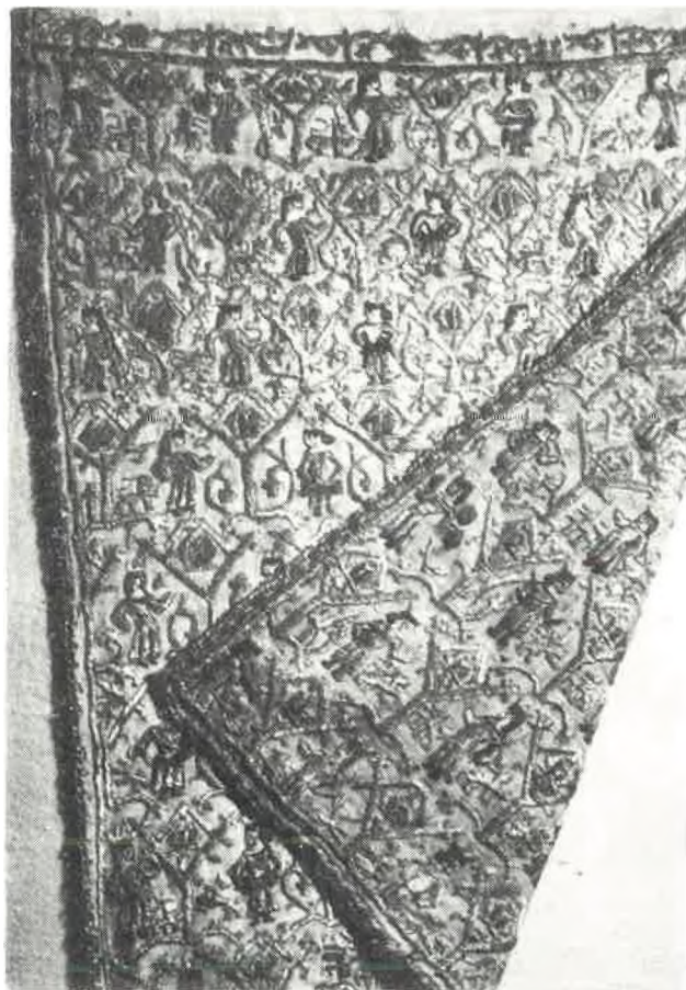
Sl. 2. Zlatni vez na licu i naličju kraljevske prevjese u raki sv. Šimuna u Zadru.