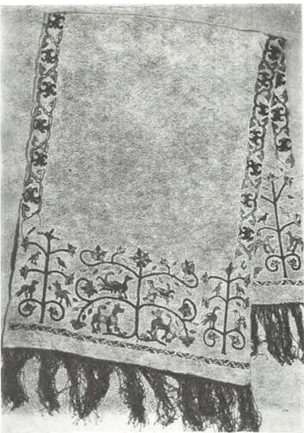
Sl. 4. Mala prevjesa u raki sv. Šimuna u Zadru, izvezena zlatnom žicom i svilom.