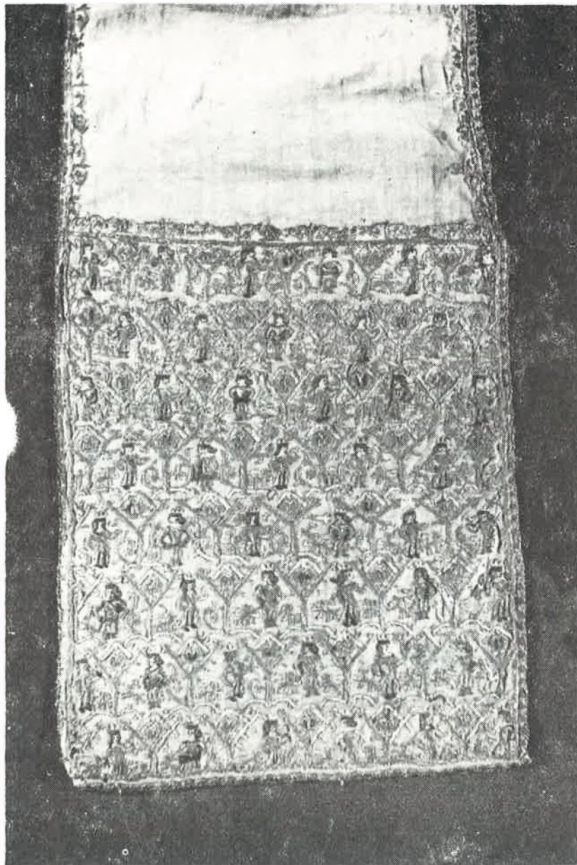
Sl. 1. Kraljevska prevjesa izvezena zlatom i svilom; ukrasni kraj fragmenta u raki sv. Šimuna u Zadru.