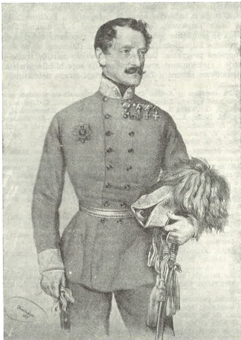
Namjesnik Lazar Mamula