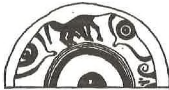
Sl. 8 Odlomak kupe »s očima«. Pula, Arheol. muzej.

Vaze »s očima«. Kod nabranjanja grčkih crnofigurnih kupa nismo spomenuli najzanimljivije primjerke, jer o njima treba govoriti na ovom mjestu. U Puli i u Zadru imamo po jednu osebujnu vazu »s očima«, tal. à occhioni , njem. Augenschale . Ona u Puli je klasična kupa, zadarska je skýphos . Pridružuje se i jedan fragment, ostatak vaze, otkopan nedavno u Zadru. Sve je u atičkom crnofigurnom koinè stilu. Poznato je da se oči, kao simbol, orijentalnog porijekla, apotropejskog značenja, slikaju na grčkim vazama, najviše na onima neslotsko halkidskog stila. Vidimo ih na mnogim kupama. Našlo ih se mnogo u Etruriji.