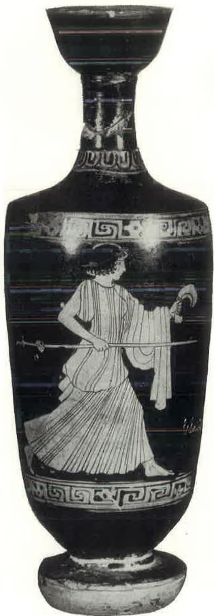
Crvenofigurni lekit nađen na Visu (Venezia Mus. archeol. Prije u Zadru, Muzej Sv. Donata)