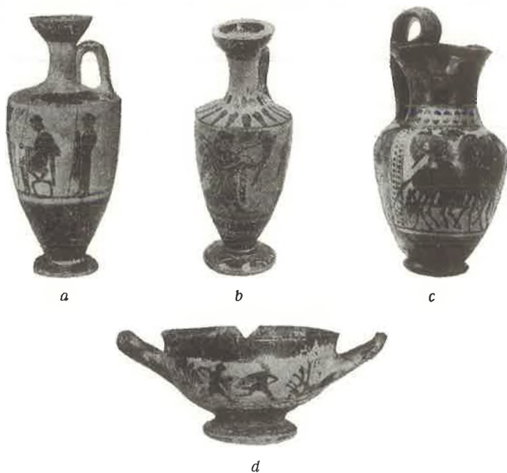
Sl. 5 Crnofigurne vaze antičkog stila; a) lekit, Sarajevo, Zem. muzej, b) lekit, Split, Arheol. muzej, c) oinochoe, Pula, Arheol. muzej, d) kupa, Sarajevo, Zem. muzej.

U Arheološkom muzeju u Splitu imamo manji lekit s nekog dalmatinskog nalazišta. Crnofigurna dekoracija: Dionisos između kopljanika. Crvenoružičasti fond očito neatički. (Vidi kod Nikolančija u splitskom Vjesniku , LXVIII, 110—111, Tab. XXI). Jedna analogija iz bolonjske Certose (Montelius, Civil. Ital. , Pl. 106, fig. 6) s Dionisom između satira, kao i motiv Dionis sa satirima na jednoj olpi iz Novog Pazara (v. dalje), upućuju na digresiju o funerarnoj simbolici.