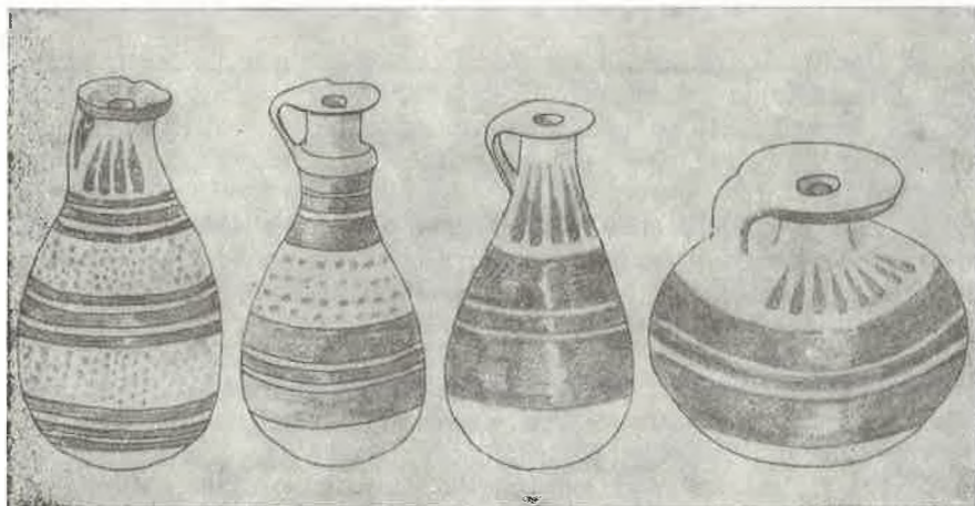
Sl. 1 Ranokorintski aribali. Vis, Općinska zbirka.*

U arheološkoj zbirci općine Vis (viški muzej) nalazi se pet korintskih vazica tipa aryballos i to tri alabastroformna aribala (zovu ih i alabastrima), jedan piriformni i jedan globularni. Svi su poznatog tipa i standardnih dimenzija (oko 10 cm vis.), s crnim ornamentima na žutom fondu gline, jedan dekoriran crvenkastosmeđe (oksidacija?), kod jednog dodaci crvenog. Varijante uglavnom istih motiva: na vratu cvjetne latice ili bez njih, na tijelu jedno ili dva polja tačkica, ili bez toga; kod svih paralelne trake različite širine uokolo, na jednom primjerku, još tipološki nedovoljno ispitanom (izostavljen