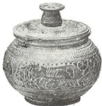
Sl. 2 Srednjokorintska piksida. Split. Arheološki muzej.

Teškoće su i sa srednjokorintskom oinochoom ( oinochōe ), navodno iz Blata na Korčuli, sada u Dubrovniku. Čini se da je s otoka Korčule ne samo ona nego i još neke od korintskih vaza koje se nalaze u dubrovačkom Gradskom muzeju. Te smo vaze zapazili pred tride-