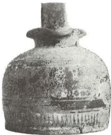
Sl. 3 Srednjokorintska oinochoe. Dubrovnik, Gradski muzej.

setak godina, prije prenošenja arheološke zbirke iz drugog sjedišta muzeja u Knežev dvor ( Vjesnik za arheologiju i historiju dalmatinsku , LII, Split 1949). Blatska-dubrovačka oinochoe odgovara po veličini, obliku i stilu dekoracije jednoj korintskoj oinochoi iz jedne grobnice otkrivene u Albaniji, na području stare Apolonije (Apolonia u Iliriji). Dekorativna osobitost naše oinochoe je centralni dio kompozicije: ukršteni lotosi s palmetama između dvije antitetičke, heraldički postavljene sirene, ptice s ljudskom bradatom glavom (duše pokojnika, njem. Seelenvogel ). Na apolonijskoj oinochoi nema sirena, ali na nekim korintskim vazama raznih formi, a iz istog groba