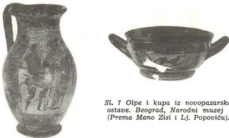
Sl. 7 Olpe i kupa iz novopazarske ostave. Beograd, Narodni muzej (Prema Mano Zisi i Lj. Popoviću).

Kad smo kod torus kupa, spomenimo još nepubliciranu jednu nađenu u Hercegovini, koja se čuva kod franjevacu u Humcu. Crno je glazirana, bez drugih ornamenata, na žalost djelomično sačuvana. Kad smo kod crno glaziranog posuđa, spomenimo npr. klasičnu kupu iz Radovina (zadarski muzej), publiciranu. Kad smo kod klasičnih kupa, s nogom, treba se sjetiti kupa iz nekropole Sv. Lucija — Most